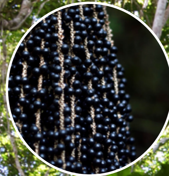
Junglebær som açai ( Euterpe oleracea ) og majo ( Oenocarpus bataua ) er populære grundet deres lave fedtindhold og høje indhold af vitaminer. Junglebærerne går derfor også under navet 'super food'. På billedet ses açai-bær.

Det beskyttede område ligger mellem to andre områder, som ligeledes er under formel beskyttelse. EAA/ACEAA-partnerskabet er således lykkedes med en af alliancens fremmeste visioner om at skabe naturkorridorer i Sydamerika, som forbinder og beskytter biodiversitets-hotspots.